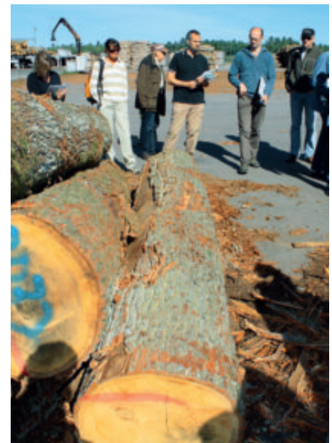
Värdesätter virket. Kährs golvfabrik i Nybro är motorn i den svenska ekproduktionen.