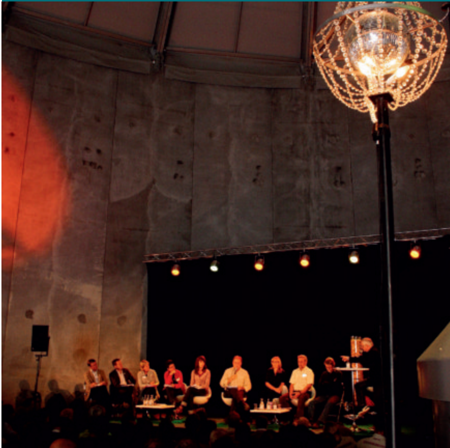
Högt i tak på Höstexkursionen. Riksdagspartierna, Svebio och Naturskyddsföreningen debatterade bioenergi inne i Igelstaverkets nya flissilo. Staffan fördelade ordet.

PRAKTISK SKOGSBOK har kommit från tryckeriet i en helt omarbetad upplaga. Den första upplagan kom 1924, utgiven i samarbete med Länsjägmästarnas förening. Enligt förordet då var boken i vissa avseende ofullständig. Författarna hoppades på gott mottagande så att man skulle kunna göra förbättringar i en kommande upplaga. Hitills har det blivit 15 upplagor!